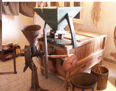
Un monte sac qui serait bien utile à La Tourelle