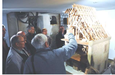
La maquette animée d'un moulin à eau intéresse les visiteurs.