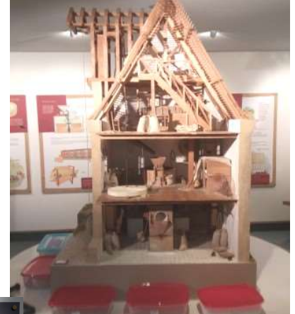
Des panneaux explicatifs détaillent chaque équipement.