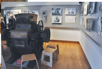
Des expositions temporaires complètent la visite