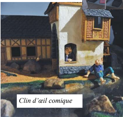
Clin d'œil comique